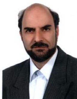
تهیه : ابراهیم عزتی

مواد خطرناک در سه حالت مایع ، جامد و گاز وجود دارند که غالباً در حوادث حمل و نقل ایجاد مشکل می نمایند.